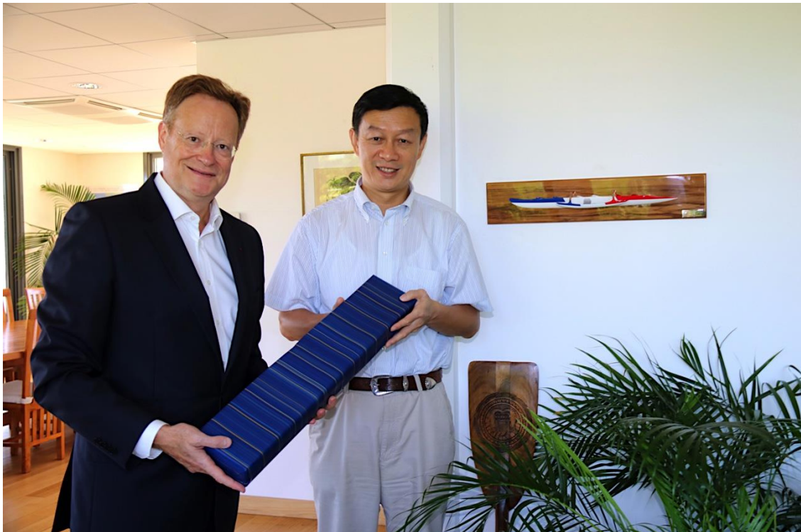
Remise de cadeau : une pirogue aux couleurs de la République comme celle qui est fixée au mur